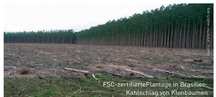
FSC-zertifizierte Plantage in Brasilien: Kahlschlag von Klonbäumen

Aufgrund der unzureichenden Kontrollmechanismen ist es außerdem möglich, Zertifikate zu fälschen, umzudeklariieren und zurückgezogene Zertifikate ohne Restriktionen weiter zu verwenden 4 . So gelangen regelmäßig Raubbauholz aus Brasilien, umdeklariertes Nadelholz aus Kanada und Sibirien oder Blutholz (Teak) aus Birma mit FSC-Siegel auf den Markt 5 .