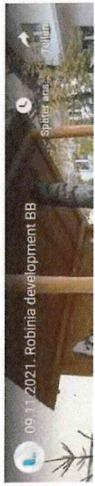
Ein paar Eindrücke aus unserer Fabrik, aus einem Beitrag im serbischen Fernsehen (auf serbisch).

Seit 2019 wird RD von einem Management-Team aus drei Frauen und einem Mann geführt. Gemeinsam streben wir danach, unsere Produktionsprozesse noch nachhaltiger zu gestalten und zur regionalen Entwicklung in Serbien beizutragen.